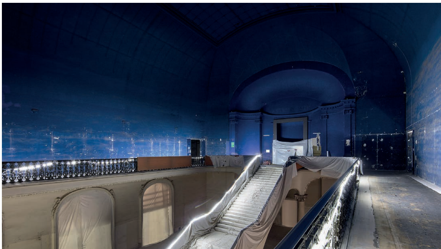
Le chantier du Grand Palais, Paris 2021