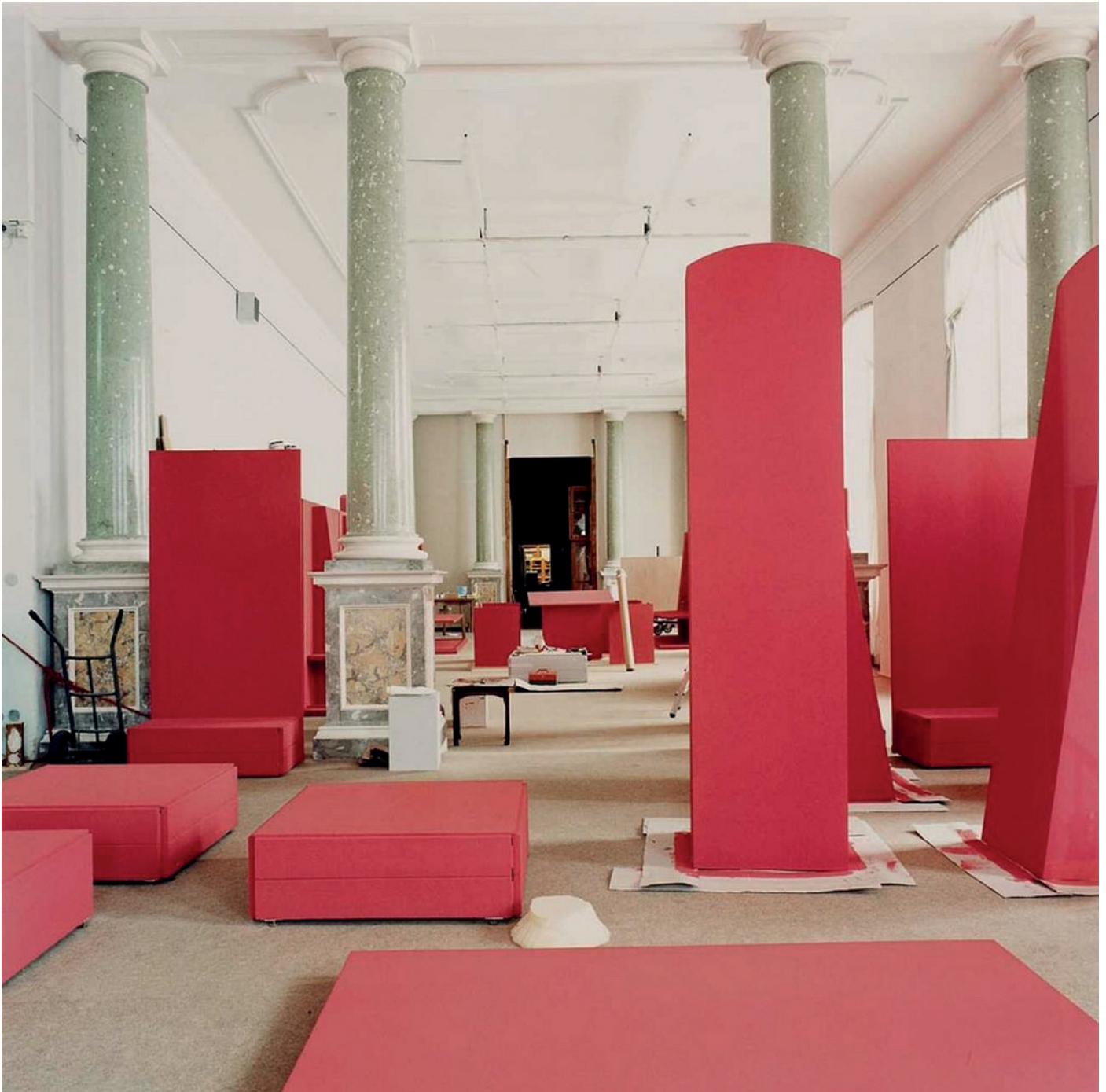
Candida Höfer Museum für Völkerkunde, Dresden II, 1999