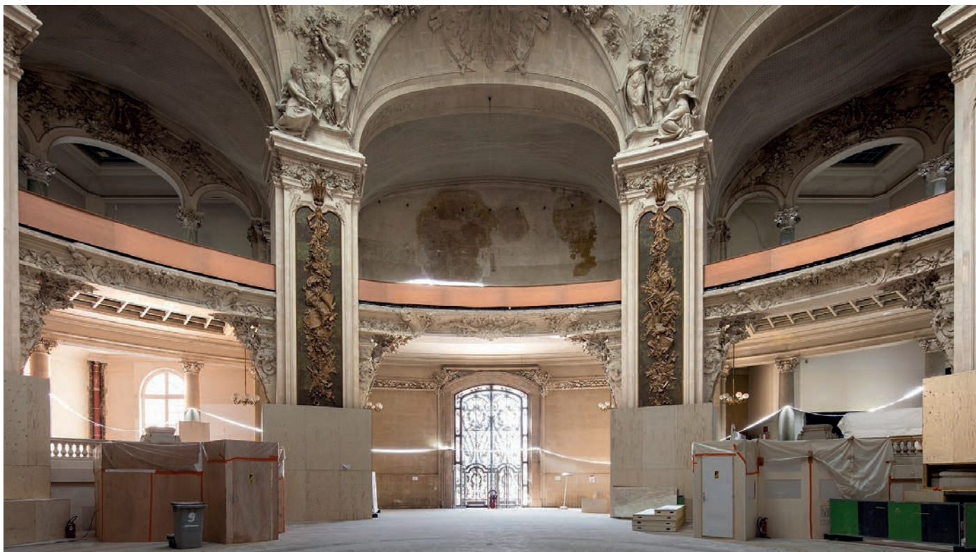
Le chantier du Grand Palais, Paris 2021